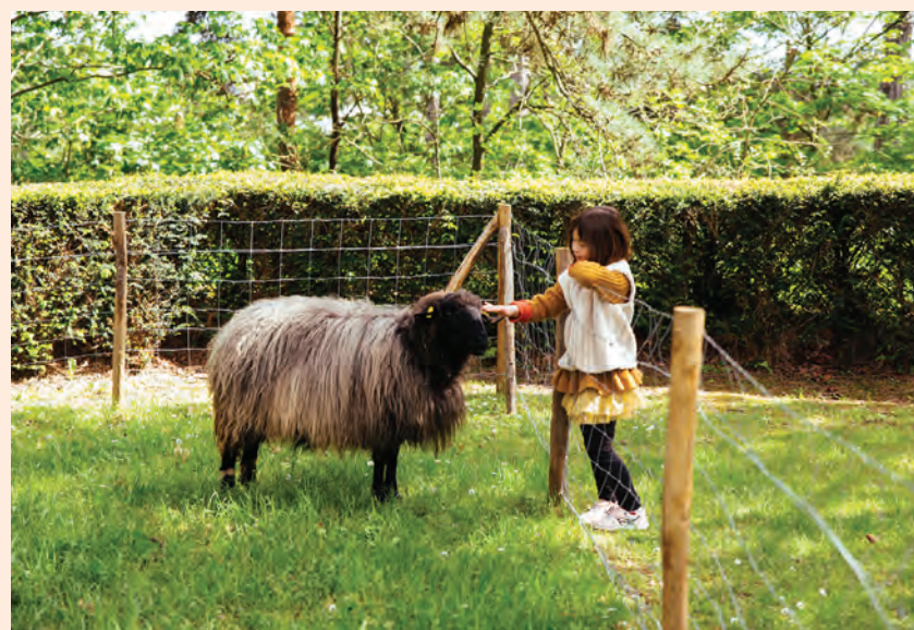
Une ferme urbaine et pédagogique.