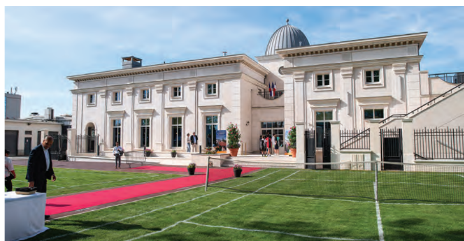
L'inauguration du nouveau Tennis club, en juin 2023.

Nous voilà déjà à mi-mandat. Comme le temps a passé vite depuis cette élection de mars 2020, à l'issue de laquelle nous avons basculé dans un premier confinement. La période compliquée que nous avons vécue nous a obligés à revoir certaines priorités et à déployer un dispositif exceptionnel pour protéger les Robinsonnais, en faisant nous-même fabriquer des masques, en organisant leur distribution et la vaccination, en mettant en place un marché « drive » et en soutenant nos commerçants.