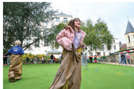
La course en sac : un grand classique qui marche toujours.

Enfin, pour ceux qui s'interrogent sur les nouveaux modes de circulation en ville