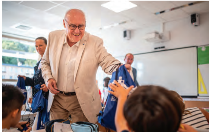
Les CP ont reçu du maire et des élus un kit de rentrée.