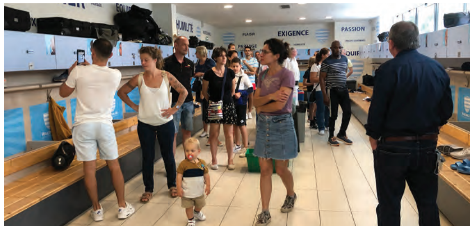
Même sans les joueurs, le vestiaire du Racing reste un lieu magique.

et d'entraînement du Racing 92, un des plus beaux d'Europe a dévoilé tout ce qui se cache derrière la fabrique à champions : vestiaires, salles de musculation, équipements de remise en forme... Sans oublier l'exposition « Le Plessis-Robinson, ville sportive » qui met en images sur les grilles du Jardin de Robinson, jusqu'à fin novembre, un siècle d'histoire sportive de notre ville.