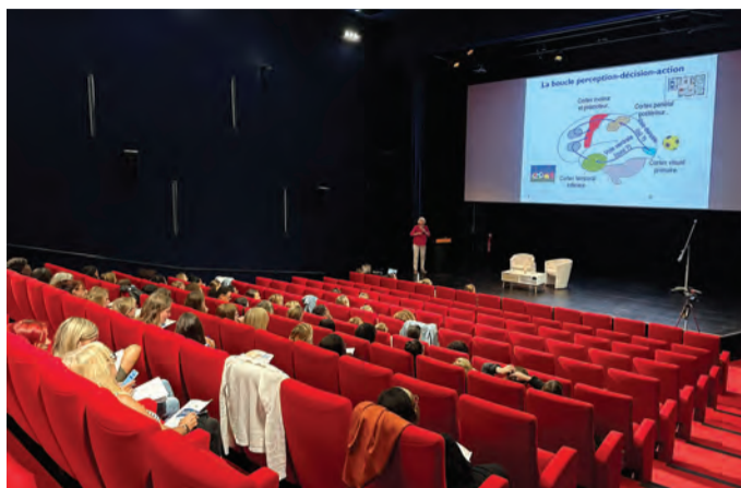
La rentrée des personnels de crèche au Théâtre de l'Allegria.