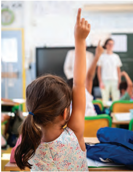
Les petits ont retrouvé le chemin de l'école.