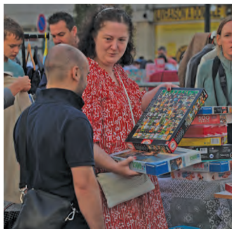
Chacun a pu faire de belles trouvailles.

L' ambiance y était chaleureuse, la météo idéale, la Foire à tout du 16 septembre a été un véritable succès. Du chineur averti, aux promeneurs en famille, tout le monde en a eu pour son compte sur l'avenue Charles-de-Gaulle que plusieurs milliers de personnes ont foulée du petit matin, jusqu'à 18h, sous un doux soleil. Parmi les rendez-vous incontournables de la rentrée, s'il y en a un que tous les Robinsonnais ont coché, c'est bien lui !