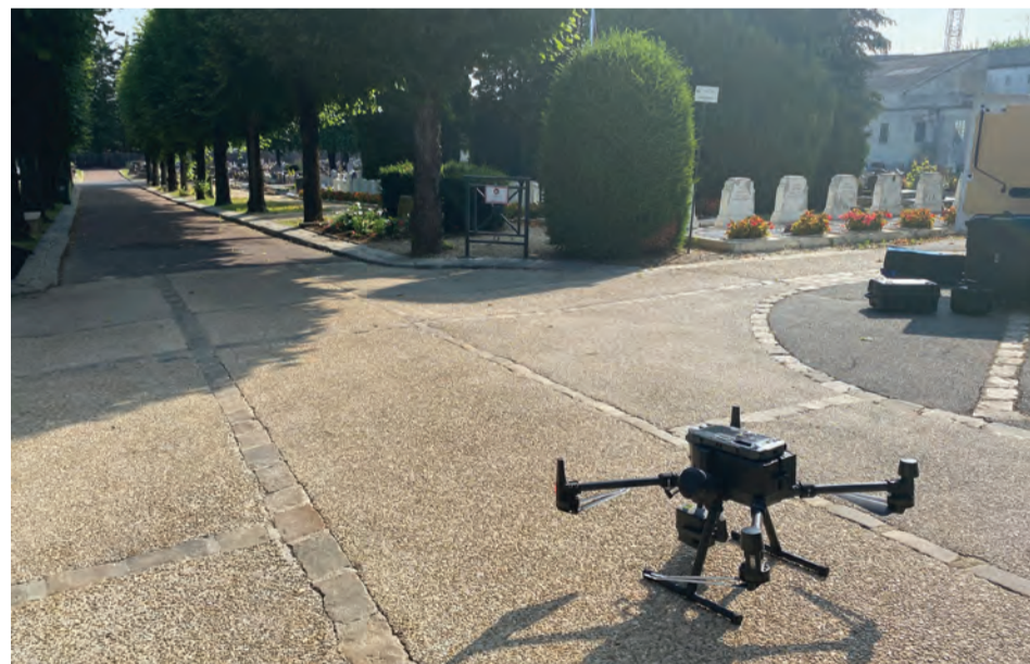
Du matériel de pointe pour cartographier le cimetière.

En juin dernier, en collaboration avec les sociétés Geofit et Geofit Expert, la Ville a réalisé une cartographie complète du cimetière à l'aide de drones. Cette initiative s'inscrit dans le cadre d'un projet visant à moderniser le logiciel de gestion du cimetière qui, à terme, permettra aux Robinsonnais de consulter des