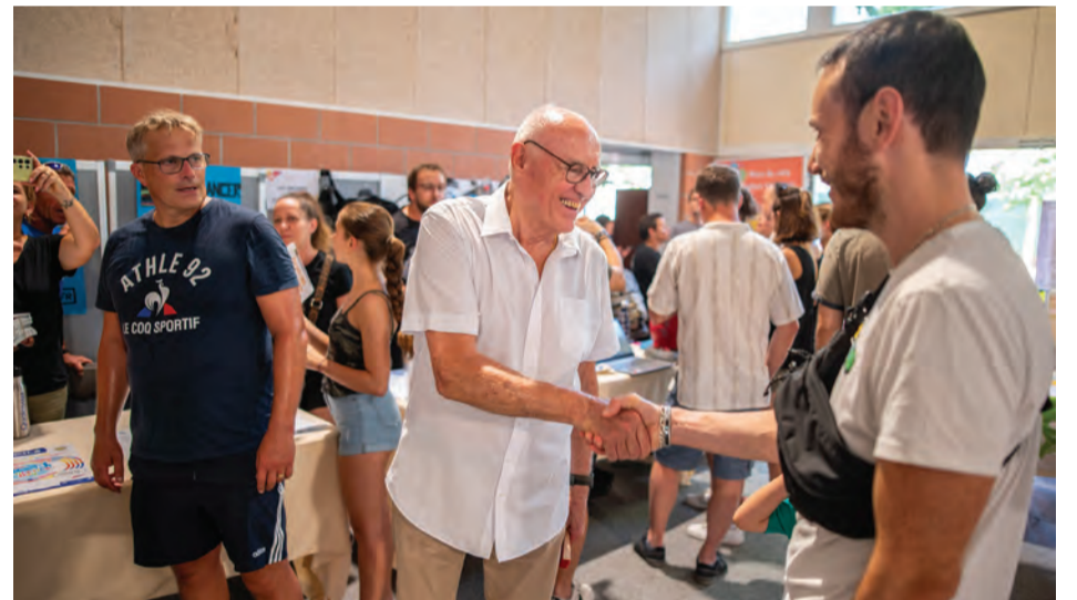
... et de croiser le maire, au détour d'une allée.