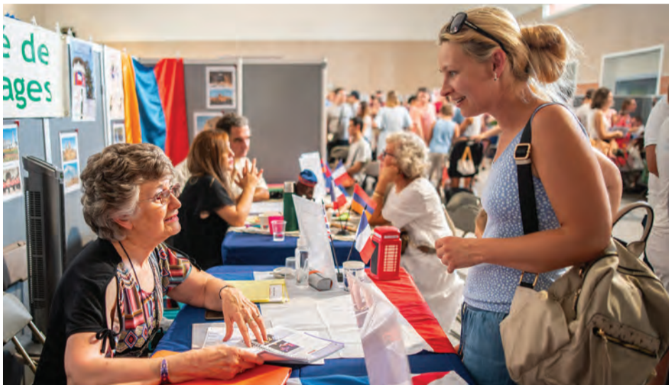
L'occasion de faire des rencontres...