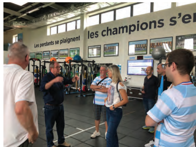
Acquérir de la force physique, et aussi mentale.