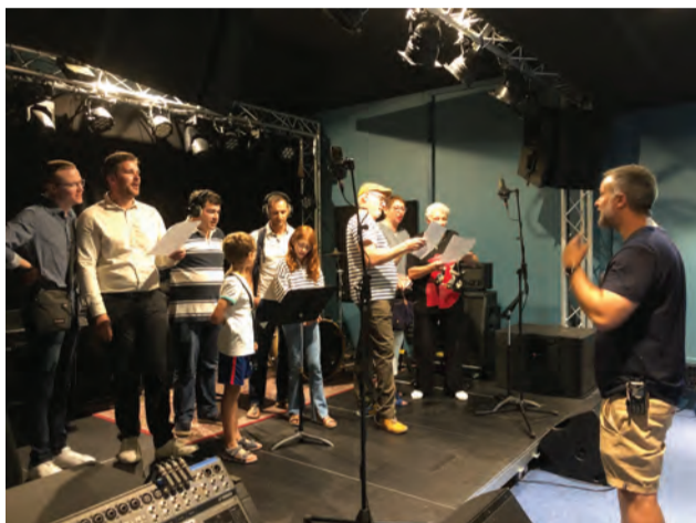
On peut même s'essayer au chant.