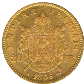
20 francs or - Armoiries impériales, 1866, pile.