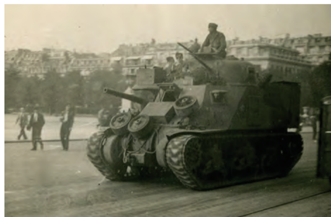
Les libérateurs arrivent à Paris par le Petit Clamart.