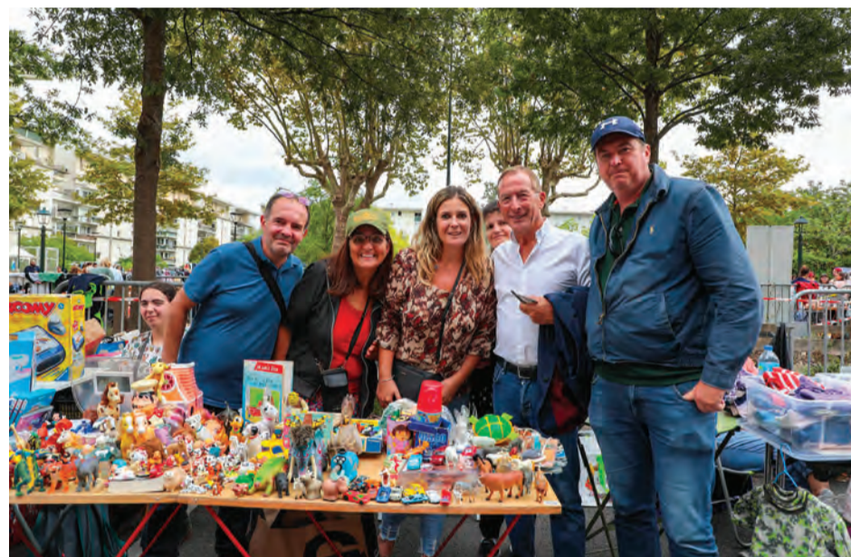
Le sénateur a rendu visite à chacun des stands de l'avenue.