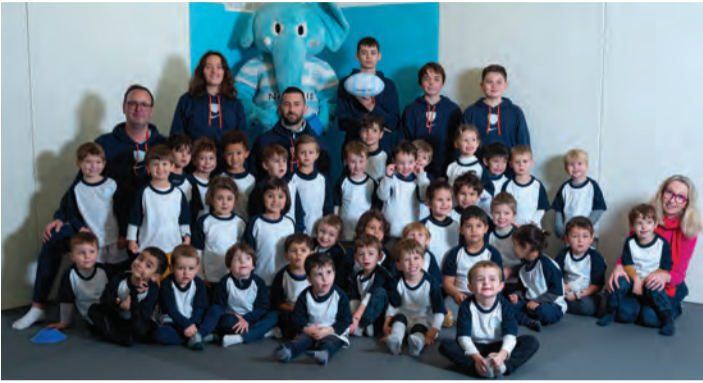
Baby-rugby, l'apprentissage du ballon ovale et de l'esprit d'équipe dès l'âge de 3 ans.