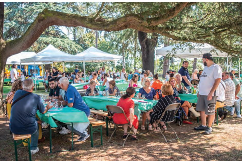
Un déjeuner convivial et chaleureux.