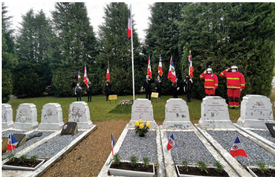
Le carré militaire, lieu de commémoration, sera remis à neuf.

Notre cimetière communal, auquel les Robinsonnais sont naturellement attachés, avait besoin d'être requalifié. C'est pourquoi la Ville a lancé un projet de modernisation et d'embellissement de son cimetière afin d'offrir aux familles offrir un espace plus accueillant et respectueux de l'environnement.