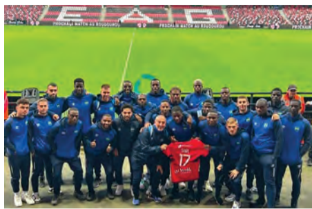
Les Robinsonnais à Guingamp pour un match de Ligue 2 en tant que spectateurs.