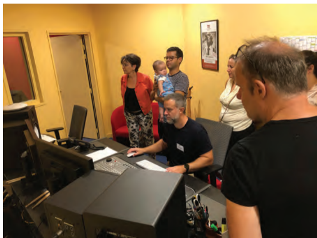
C'est grâce à la régie que la musique prend vie.