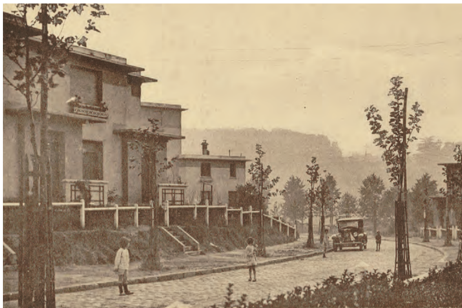
Les enfants autour d'une des premières voitures de la Cité basse, vers 1930.

C'est en 1923 que la première cité-jardins, la Cité basse, est sortie de terre, et que le petit village s'est changé en ville. Il ne reste plus de témoin de cet événement et les derniers habitants de l'entre-deux-guerres au Plessis-Robinson commencent à disparaître. Il est donc important de recueillir les souvenirs de ces derniers témoins, les identifier, les écouter