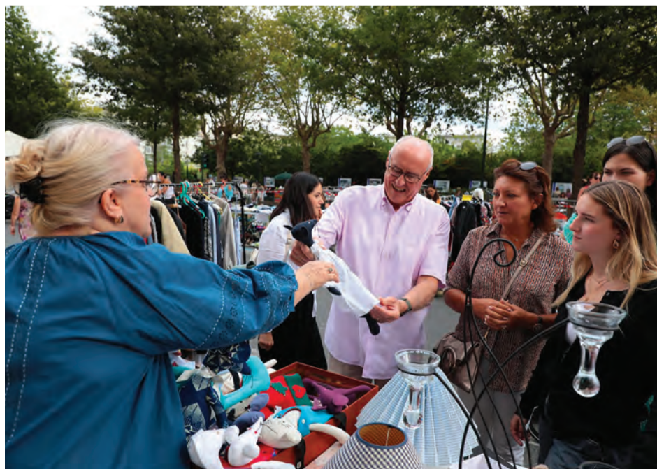
Le maire a lui aussi pu chiner à loisir.