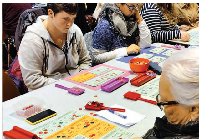
Un rendez-vous incontournable.

un voyage ! Boissons et autres joyeusetés gustatives seront disponibles en cas de petit creux ou petite soif. Comme toujours, l'intégralité des bénéfices de cette manifestation sera utilisée pour financer les projets culturels et les actions sociales de l'association.