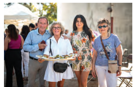
Le sénateur était présent, en compagnie des membres du Comité de Jumelages.

C 'est sous un ciel bleu et un grand soleil que les fidèles s'étaient donné rendez-vous en ce dimanche champêtre du 10 septembre, pour célébrer l'amitié entre la France et l'Arménie. Le Comité de Jumelages organisait en effet son traditionnel déjeuner franco-arménien au Moulin Fidel. Les animations se sont entremêlées de mets d'origine arménienne (notamment le fameux barbecue géant), et de sourires