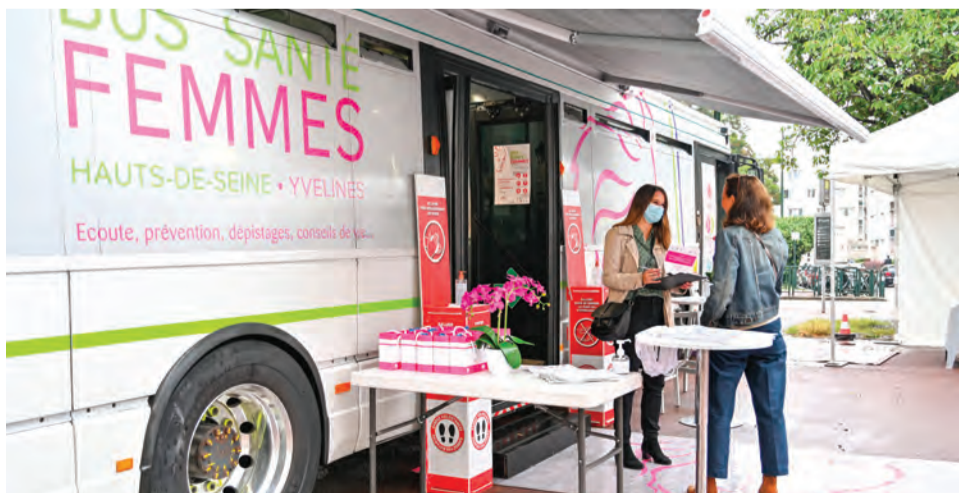
Un dispositif gratuit, pour toutes.

Le Plessis-Robinson accueillera de nouveau, place du 8 mai 1945, vendredi 20 octobre de 9h à 13h, le