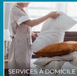
SERVICES À DOMICILE