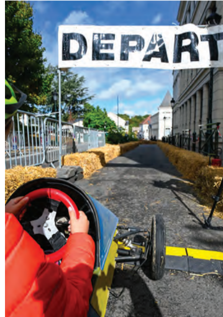
Tous prêts à se lancer...

Pour cette deuxième édition, les « Courses en fête » du Plessis-Robinson promettent toujours plus de surprises, de rires et de moments de joie partagée pour les Robinsonnais de tous âges. Rendez-vous tout l'après-midi du samedi 14 octobre, dès 13h30, rue de la Ferme où tous les amateurs de sensations fortes se rejoindront pour le départ de l'événement fort de la journée : la course de caisses à savon ! Au programme, une folle descente qui mènera les concurrents, passé le grand virage, jusqu'à l'arrivée située sous l'arche du passage de l'Escargot d'or. Qui finira la course sans encombre ? Pour encourager les coureurs, rendez-vous au départ et à l'arrivée, où en se