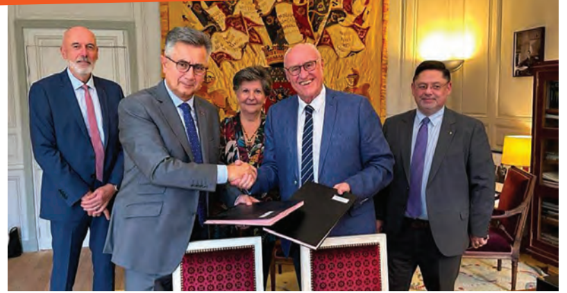
Le Plessis-Robinson est maintenant partenaire de l'Ordre de la Libération.

ment des visites gratuites du musée pour les jeunes Robinsonnais et ainsi participe à la préservation du devoir de mémoire.