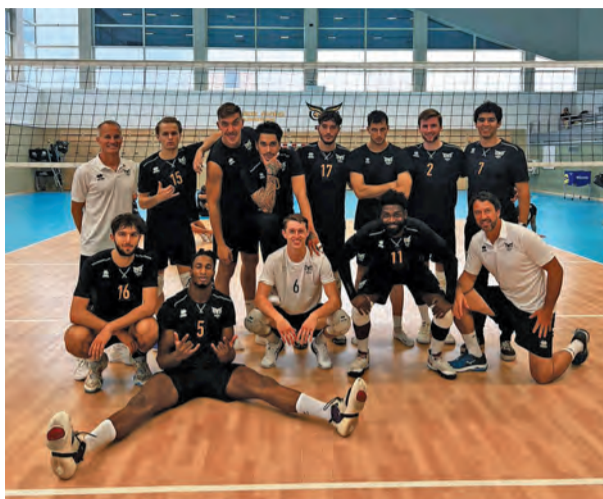
Même incomplète, l'équipe des Hiboux continue sa préparation.

La reprise des Hiboux du Plessis-Robinson Volley-Ball (PRVB) a été légèrement perturbée (même si anticipée) par l'Euro de volley terminé en septembre. Le staff a pu organiser plusieurs matches amicaux afin de parfaire les connexions et renforcer l'esprit d'équipe dont l'effectif a été fortement remanié. C'est sans médaille autour du cou que rentre dans les rangs