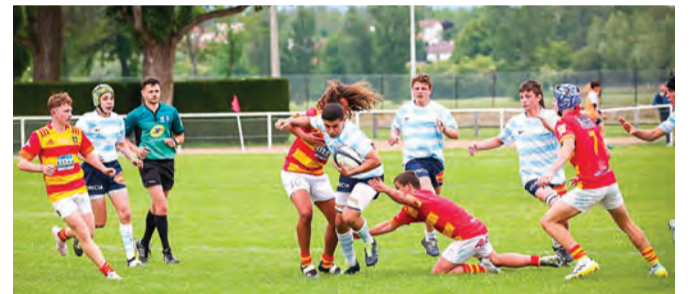
Plus tard, on découvre le jeu collectif et la compétition.

Dans un pays reconnu aujourd'hui en matière de formation, le Racing fait partie des clubs les plus en vue. Avec depuis peu, une nouvelle corde à son arc : le rugby féminin. De plus en plus de petites filles intègrent l'École de rugby, certaines se lancent dans la compétition et aujourd'hui 80 filles jouent sous les couleurs du Racing. C'est un formidable potentiel de développement pour un sport qui va peut-être, si la victoire nous sourit, faire de nous des champions du monde.