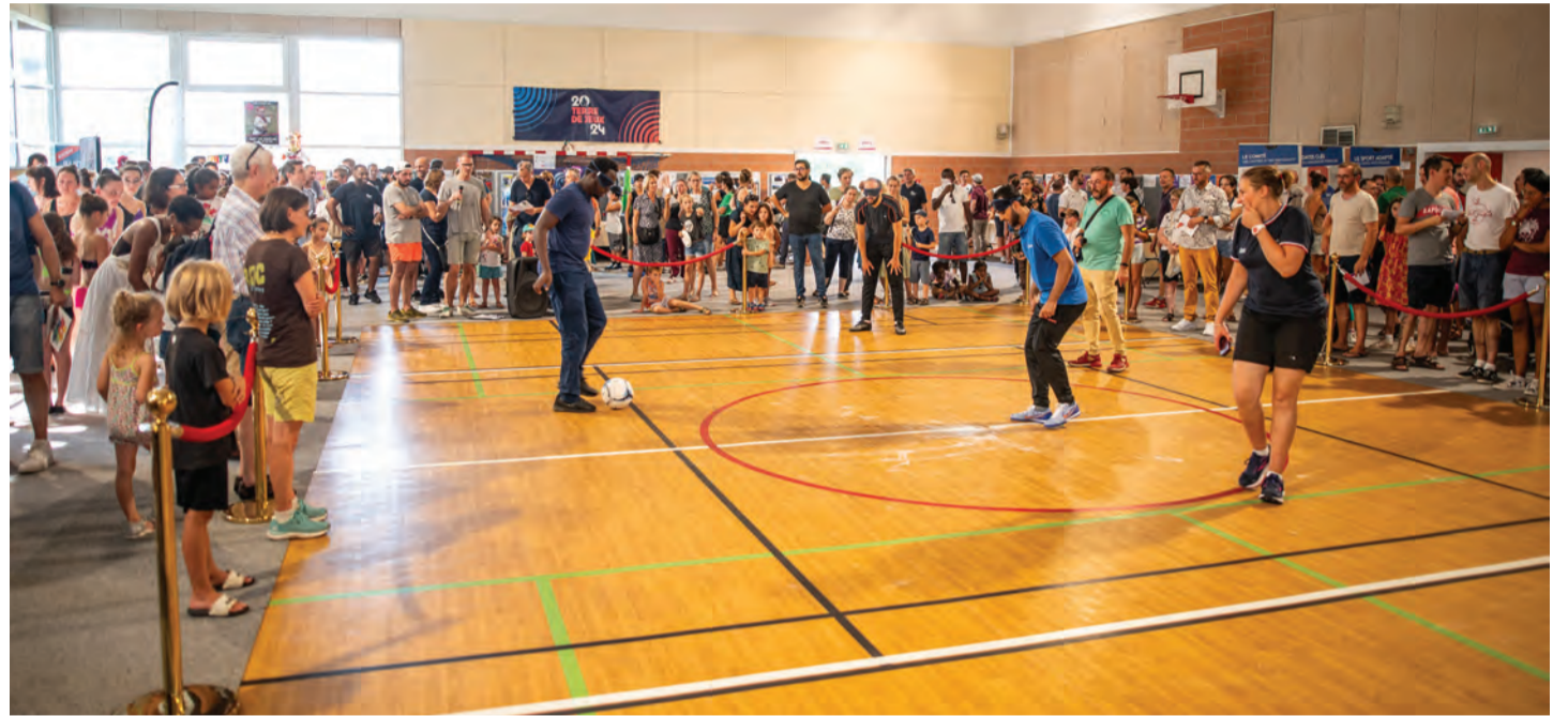
L'espace de démonstration a encore recueilli un grand succès.