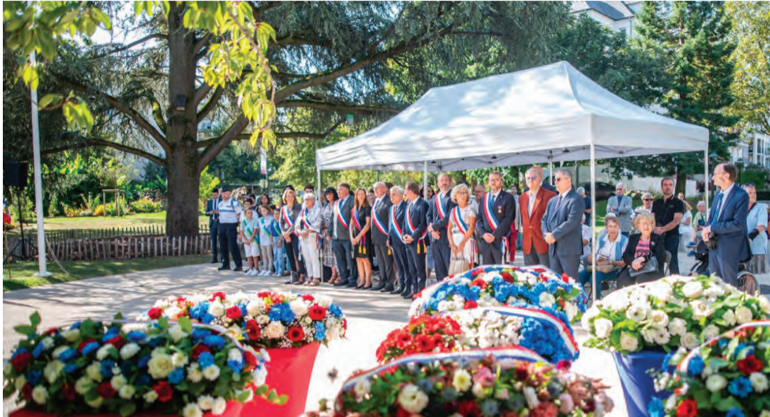
Le recueillement devant les nombreuses gerbes.