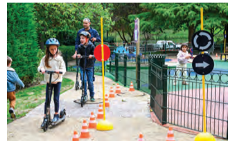
L'occasion de découvrir les règles de la circulation.

et sur l'éventuel achat d'une trottinette électrique, cette journée sera l'occasion de venir essayer l'un des modèles mis à disposition sur le circuit dans la cour de l'école Anatole-France, et obtenir des renseignements sur les règles de circulation.