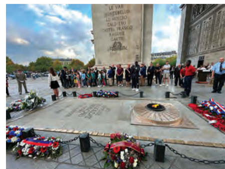
Faire durer la mémoire, en ravivant la flamme.