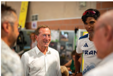
Le sénateur est venu saluer les bénévoles.