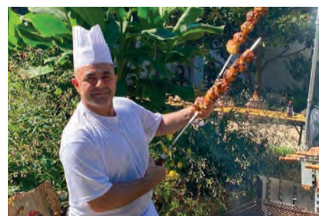
Le barbecue géant arménien.

C 'est sous un ciel bleu et un grand soleil que les fidèles s'étaient donné rendez-vous en ce dimanche champêtre du 10 septembre, pour célébrer l'amitié entre la France et l'Arménie. Le Comité de Jumelages organisait en effet son traditionnel déjeuner franco-arménien au Moulin Fidel. Les animations se sont entremêlées de mets d'origine arménienne (notamment le fameux barbecue géant), et de sourires