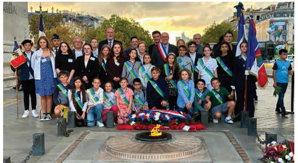
Les jeunes Robinsonnais rassemblés sous l'Arc de triomphe avec leurs élus.