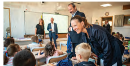
L'année scolaire peut commencer avec le sourire.

lant de petites bricoles à des réfections plus conséquentes, sans oublier que le service Entretien a accompli le traditionnel grand ménage estival. Tout était donc en place pour que les enfants et les équipes pédagogiques puissent travailler dans les meilleures conditions.