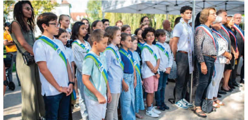
Les jeunes sont largement associés au devoir de mémoire.