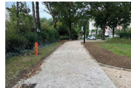
Un premier tronçon en chantier.

à vélo ou en trottinette, et aussi d'offrir une voie de promenade pour les piétons. Le point le plus délicat reste le passage du Parc Henri-Sellier, sur un site en pente, et avec des contraintes de circulation et d'environnement fortes. Mais chaque chose en son temps : voyons ce que peut apporter ce prototype et les usages qu'on va lui donner.