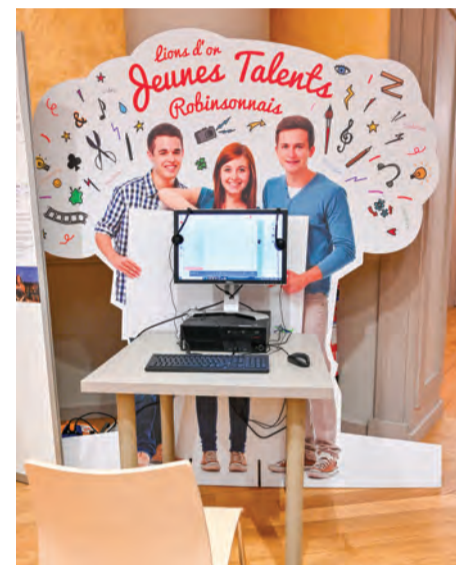
Venez soutenir les jeunes talents de la ville.

Remise des prix des Jeunes Talents Robinsonnais Mercredi 18 octobre, à 19h Salle de conférences de la Maison des Arts