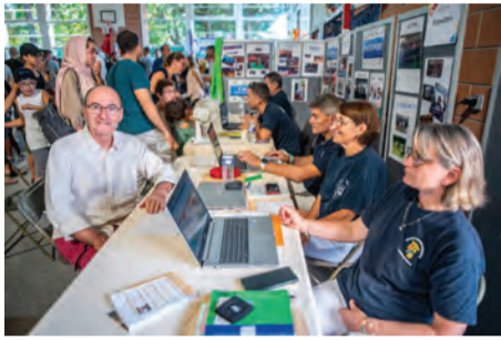
Les stands du Forum, un lieu d'information.

accrue par les stands gourmands, pratiques ou encore les espaces de démonstration.