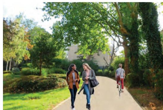
Une circulation douce, mixte piétons et deux-roues (non motorisés).

On se souvient du projet de Voie verte lancé en 2020 par la Municipalité, dont la réalisation a été retardée par un certain nombre de difficultés techniques et juridiques. Pour autant, le projet n'est pas abandonné et un prototype est en cours d'aménagement dans le quartier Albert-Thomas. Une bande mixte vélo-piétons, en aggloméré, d'une longueur pour le moment de 50 m, reliera à terme l'entrée du Plessis-Robinson en arrivant de Châtenay-Malabry et la place des Alliés. Le terrain appartient à Hauts-de-Seine Habitat, c'est le territoire Vallée Sud – Grand Paris qui fait les travaux et c'est la Ville qui en assurera l'entretien. Le prototype sera achevé pour le début du mois d'octobre et tous les habitants du secteur Albert-Thomas auront la possibilité de donner leur avis, à travers une