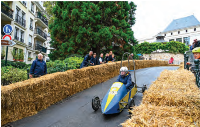
Venez avec votre plus beau bolide !

positionnant le long de la rue de l'Orangerie.