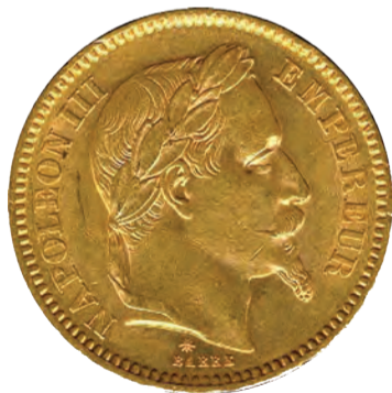
20 francs or - Napoléon III, tête laurée, 1866, face.

accordé tandis que l'instruction publique est favorisée, y compris pour les filles, dont Julie-Victoire Daubié est la première bachelière en 1861.