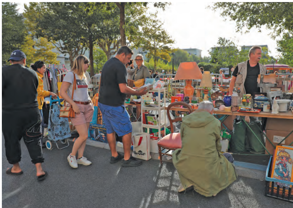
Le soleil était au rendez-vous toute la journée.