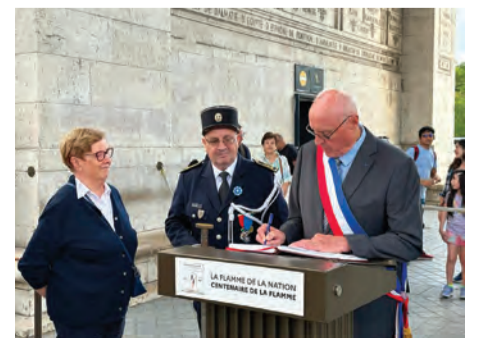
Le maire a signé le livre d'or.