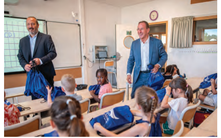
Le sénateur n'a pas manqué de motiver les élèves.

semaines sans se voir. Après s'être raconté brièvement leurs vacances, l'heure fût venue de s'installer et de se lancer pleinement vers l'apprentissage.