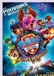
LA PAT' PATROUILLE : LA SUPER PATROUILLE LE FILM