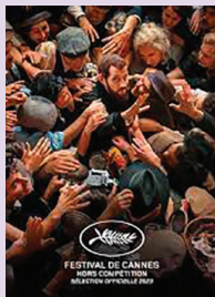
L'ABBÉ PIERRE - UNE VIE DE COMBAT