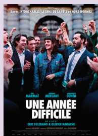
UNE ANNÉE DIFFICILE