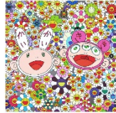
Tableau Murakami « Pop-Art » : Fleur de table Fresque printanière